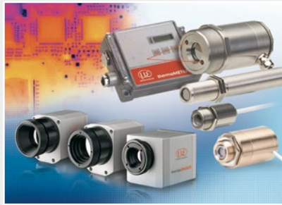
Sensoren und Messgeräte für berührungslose Temperaturmessung