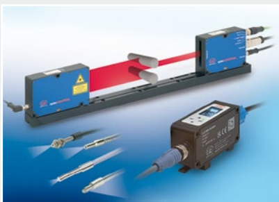
Optische Mikrometer, Lichtleiter, Mess- und Prüfverstärker