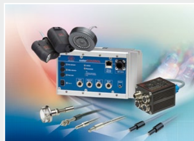
Sensoren zur Farberkennung, LED Analyser und Inline-Farbspektrometer