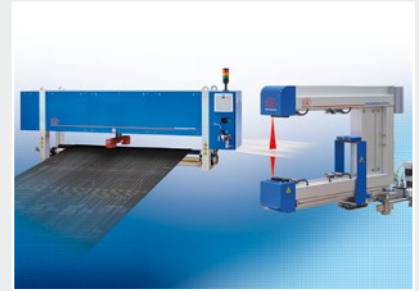
Mess- und Prüfanlagen zur Qualitätssicherung