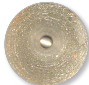
Ablagerungen im Rohr