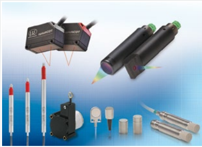
Sensoren und Systeme für Weg, Position und Dimension