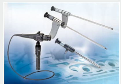
Technische Endoskopie, Lichtquellen